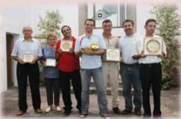
I vincitori 2010

Prima la pagaia, poi la forchetta! Discesa in rafting dei vigneti del Sassella"