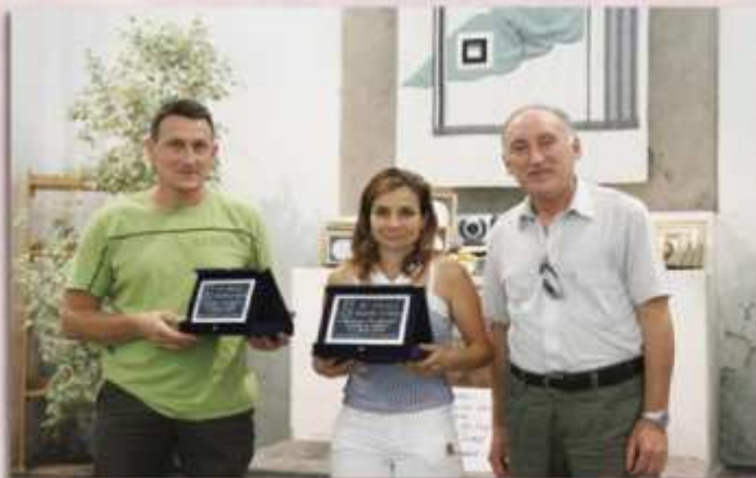
Premiazione "Il Filare 2010"

Ci rendiamo conto, però, che la scelta probabilmente non sarà semplice, perciò ci teniamo a sottolineare che questo riconoscimento sarà il primo di una lunga serie in modo di arrivare con gli anni a premiare tutti i vignaioli meritevoli che sono comunque invitati a partecipare alla festa.