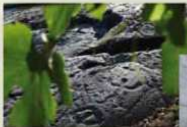
Il mulin de la Rosina